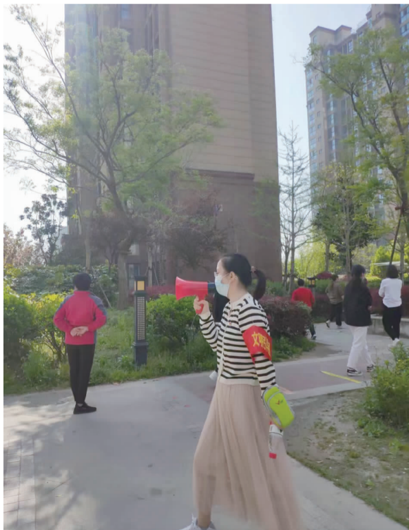
“网红”小楼长的抗疫周记

当了这么多天的志愿者,我深切的感受到抗疫工作者的艰辛和不易,但我还是选择勇敢的“逆行”,因为我是新时代的通港人。