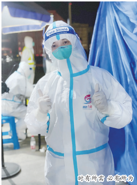
时有所需 必有所为

今天卡口车辆分外多,一个班登记的车辆数是前几天的翻倍。登记货车信息的工作依然有序进行着,正当我埋头核对一名司机信息时,卡点的队友跟上来递给他一只橘子,原来是刚刚查码时队友发现司机有点低血糖,我连忙也递