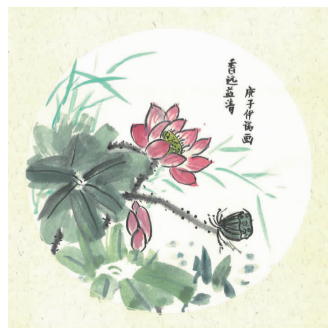
香远益清(通海公司 孙宗伊诺 财务部孙磊女儿)