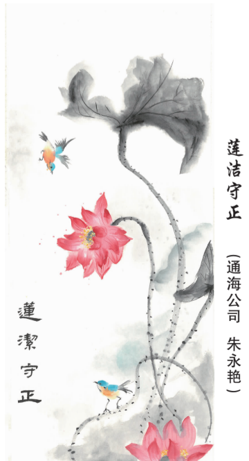
莲洁守正 (通海公司 朱永艳)