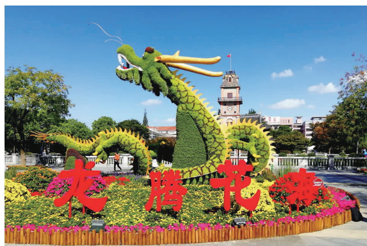
龙腾花海

只有在长江里拼搏才能找到梦想 心灵的激流是奔涌不息的走向 把群星闪烁的夜光照亮 到中流击水,浪遏飞舟,这是新的起航 心怀梦想,我们相遇在长江 激动的音符早已在我流泪的心中回荡