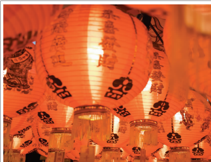
张灯结彩过新年

南通, 拨动一根大自然的琴弦 弹奏天籁 人们每天沐浴, 濯洗 游走于一幅天蓝地绿的画卷 不小心做了优雅的画中人