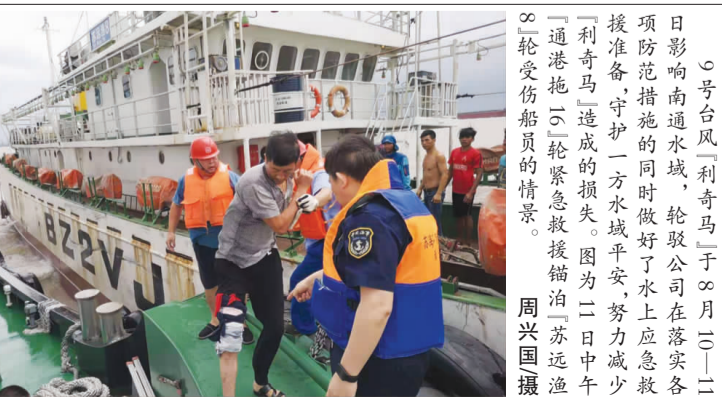
受台风“利奇马”于8月21日影响南通水域,轮驳公司在落实各项防范措施的同时做好了水上应急救援准备,守护一方水域平安,努力减少“利奇马”造成的损失。图为二日中午“通港拖16”轮紧急救援拖泊“苏远渔8”轮受伤船员的情景。

岗尽责,密切关注台风动向,加强防台应急保障,确保信息渠道畅通,突发情况按照应急预案要求做好应急处置,确保将超强台风带来的影响降至最低。台风过后,各单位要做好复工前的安全检查,保证企业安全顺利地恢复生产、建设。